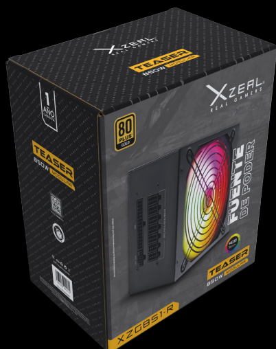
Imagen sólo para fines ilustrativos/Image for illustrative purposes only