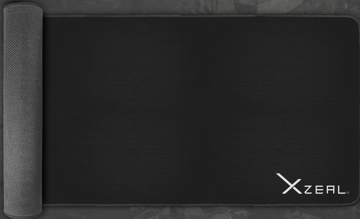
Imagen sólo para fines ilustrativos/Image for illustrative purposes only