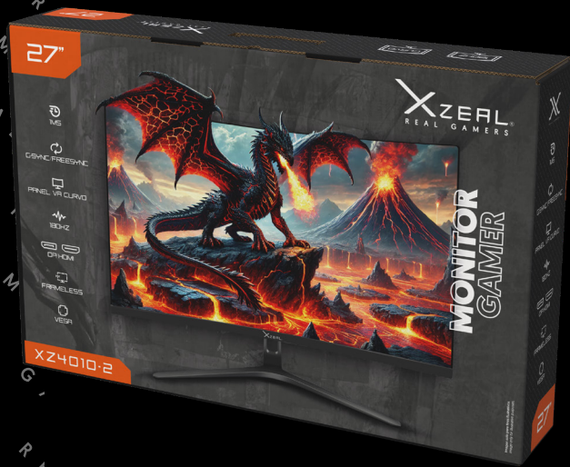
Imagen sólo para fines ilustrativos/image for illustrative purposes only

Puertos (HDMI, DP, AUDIO, DC) Ports (HDMI, DP, AUDIO, DC)