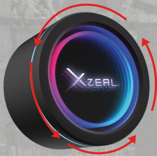
Imagen solo para fines ilustrativos / Image for illustrative purposes only

Bomba efecto infinito ajustable, gira el módulo para alinear el logotipo correctamente