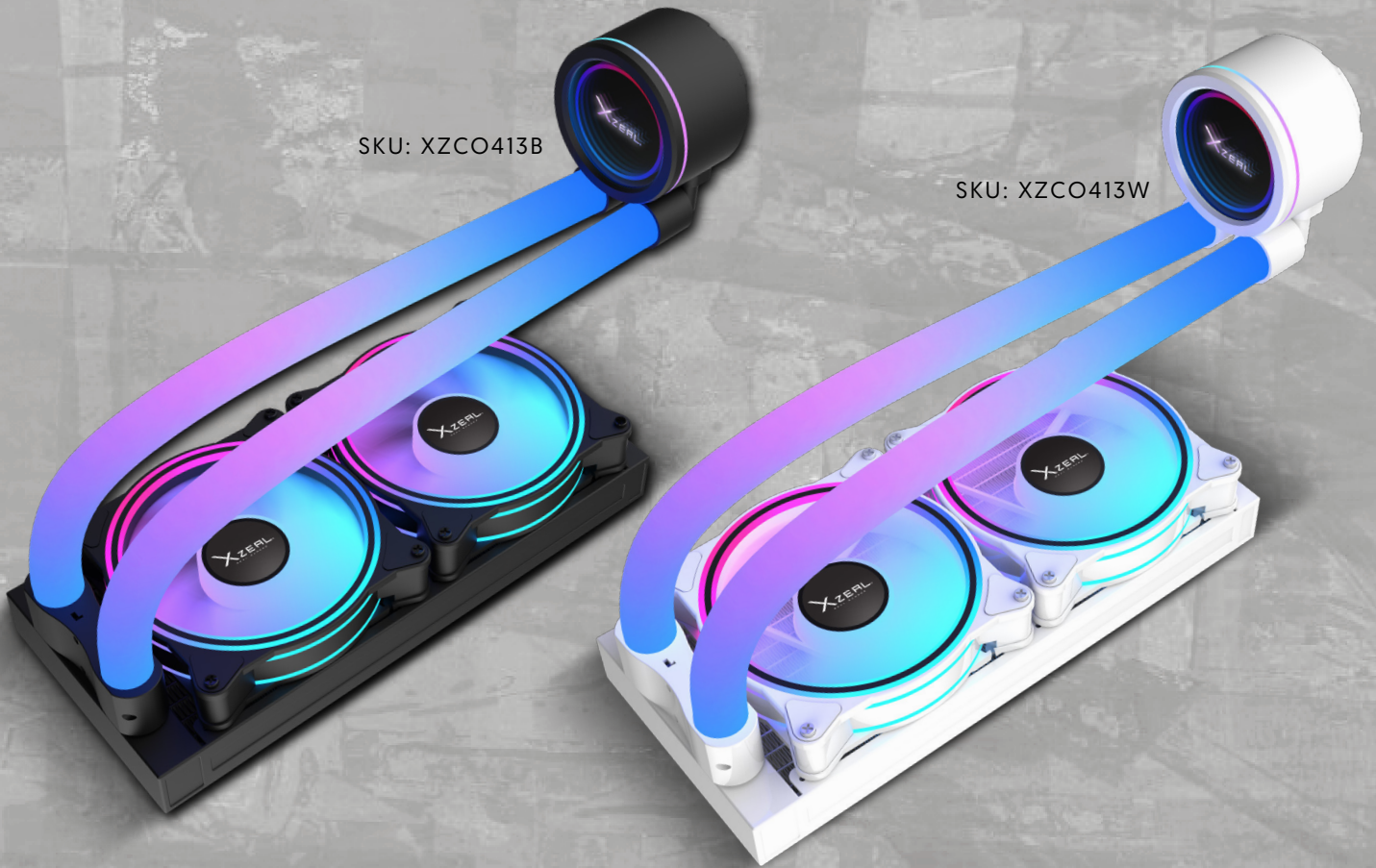
Imagen sólo para fines ilustrativos/Image for illustrative purposes only