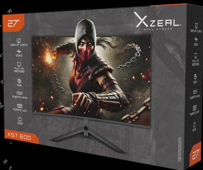
Imagen sólo para fines ilustrativos/Image for illustrative purposes only