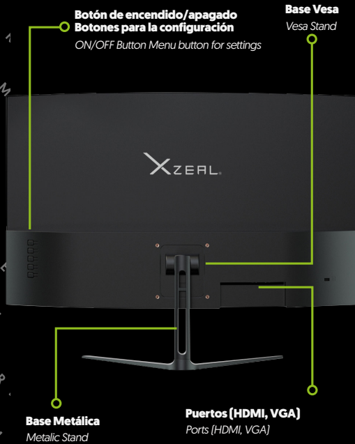
Imagen sólo para fines ilustrativos/Image for illustrative purposes only